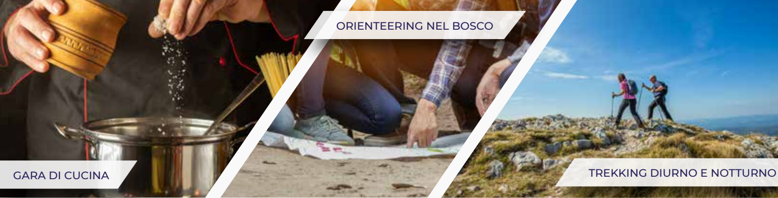
ORIENTEERING NEL BOSCO