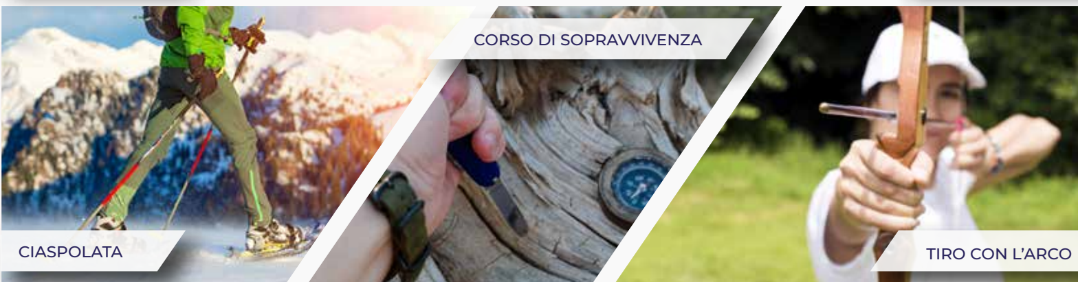
CORSO DI SOPRAVVIVENZA