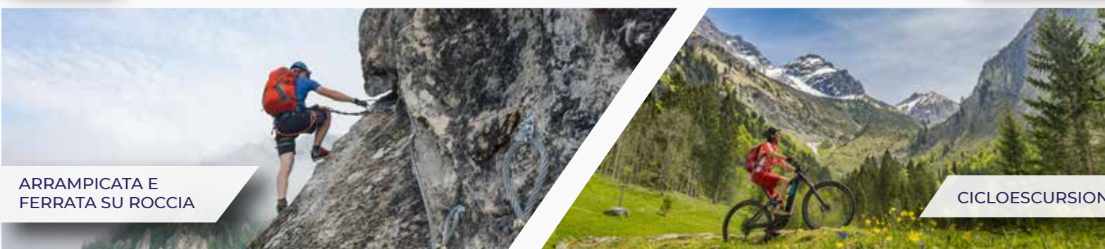
ARRAMPICATA E FERRATA SU ROCCIA